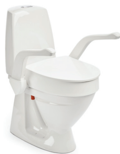
My-Loo mit Armlehnen 100 mm