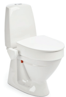
My-Loo 100 mm