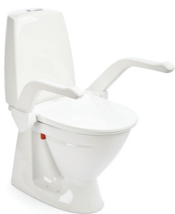
My-Loo mit Armlehnen 20 mm

Die glatten Oberflächen lassen sich leicht mit einem weichen Tuch abwischen und säubern. Sollte eine getrennte Reinigung erforderlich sein, lassen sich Sitz und Armlehnen leicht aus ihren Halterungen entfernen und ebenso einfach wieder einsetzen, ohne die Toilettensitzerhöhung zu deinstallieren.