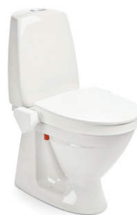
My-Loo 60 mm